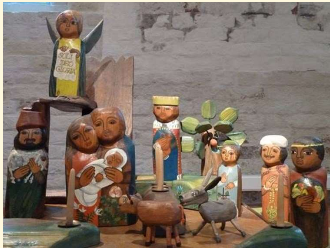
Weihnachtskrippen in Heilig Geist Güstrow – Mechthild und Dr. Rudolf Ringguth-Stiftung